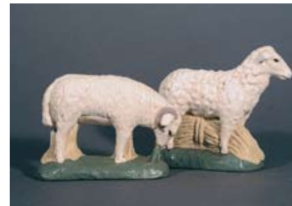
2 Schafe stehend 95.- SFr.