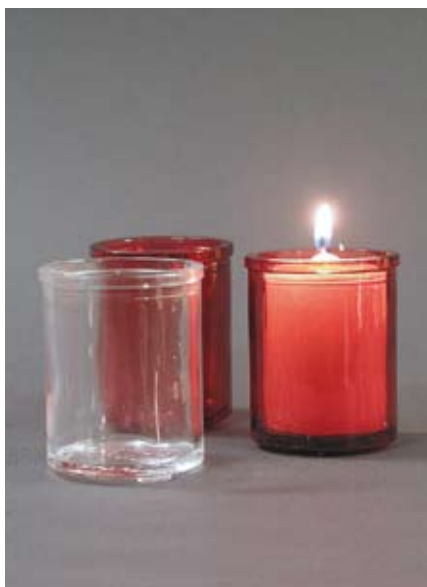
Lichtgläser Für St Ursula Kerzen oder Öllichter rot oder weiss, Höhe 6 cm, 1 Stk. 6.50 SFr.