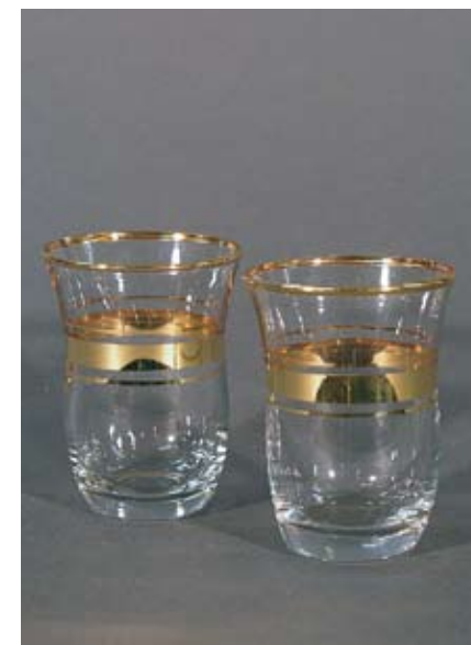
Kleine Glasvasen Glas mit Goldrand, 2 Stk. 9.50 SFr.