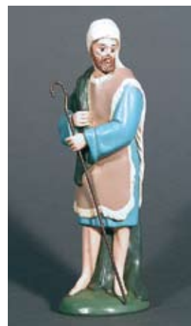
Hirte mit Stab 55.– SFr.