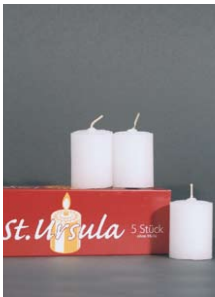
St. Ursula Kerzen, 24 Stunden (nur für Lichtgläser!) 5 Stk. 8.50 SFr.