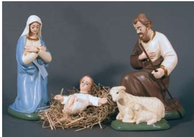
Hl. Familie 285.- SFr. Josef, Maria, Jesuskind & Schafgruppe

Diese Darstellung entstand gegen Ende des 19. Jahrhunderts und stand in der Weihnachtszeit schon in den Stuben unserer Gross- und Urgrosseltern! Figurenhöhe 20 cm