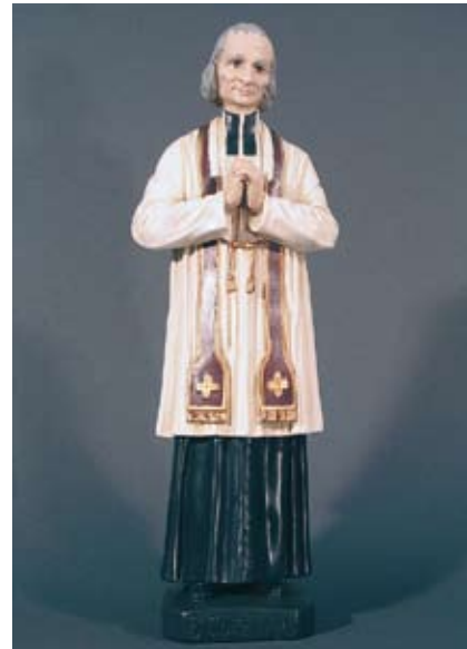
Hl. Pfarrer v. Ars Ich liebe Dich, oh unendlich liebenswürdi- ger Gott! Betet für gute Priester.