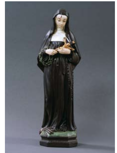
Hl. Rita Du Helferin in aussichtslosen Anliegen! Lehre uns die Liebe zu Christus!