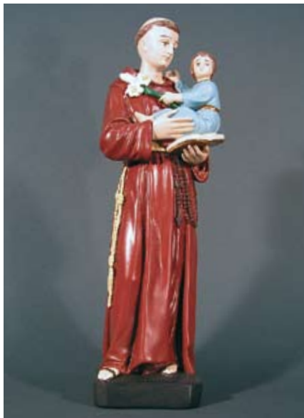
Hl. Antonius v. Padua Du treuer Diener des Allerhöchsten, Du Helfer der Notleidenden.