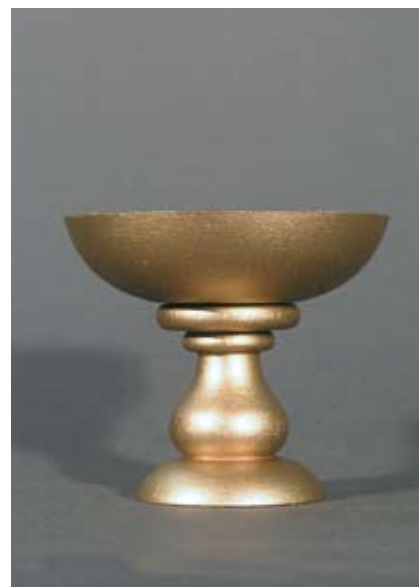
Weihrauchbrennschale Buchenholz und Metall, 25.- SFr.