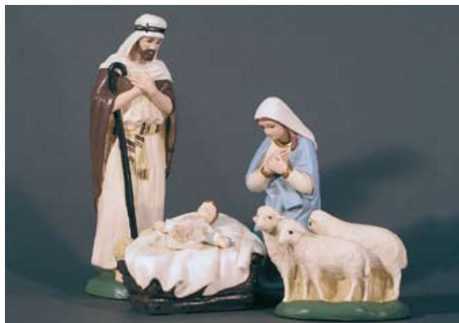
Hl. Familie 165.– SFr. Josef, Maria, Jesuskind & Schafgruppe

Wunderschöne Darstellung der Geburt Christi in hebräischen Gewändern. Figurenhöhe 17 cm