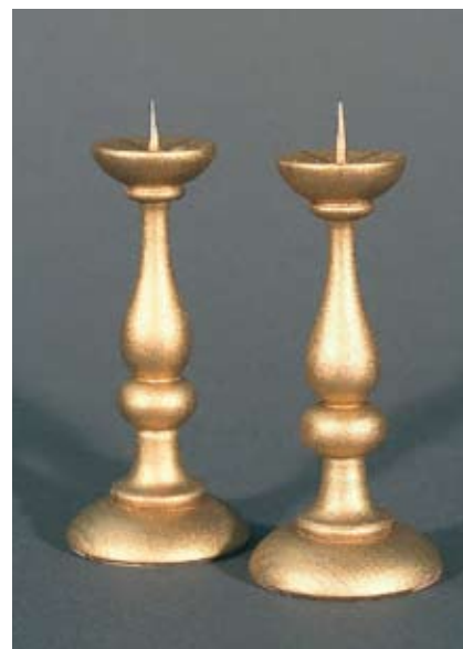
Kerzenstöcke Buchenholz gedrechselt 10 cm golden bemalt, 2 Stk. 48.– SFr.