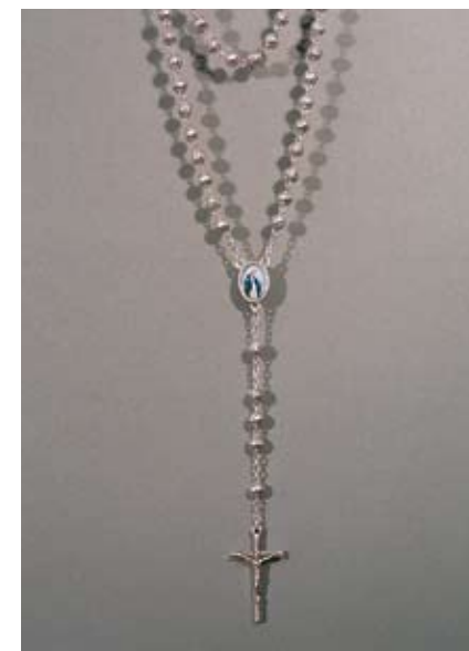
Rosenkranz Ave Maria Metall versilbert, 25.- SFr.