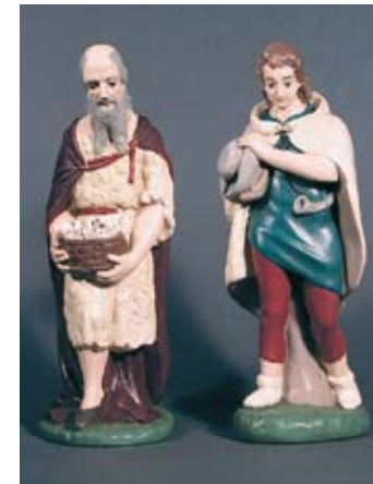
2 Hirten 210.- SFr.