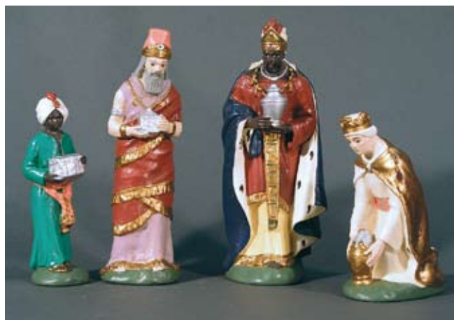
Hl. Drei Könige 245.– SFr. Caspar, Melchior, Balthasar & Diener