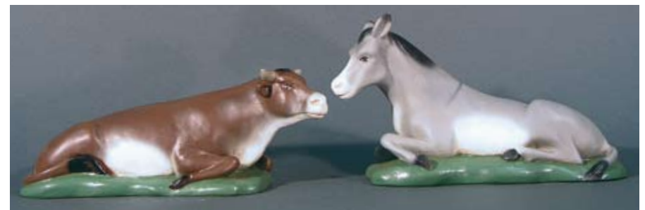
Esel & Ochse 175.- SFr.