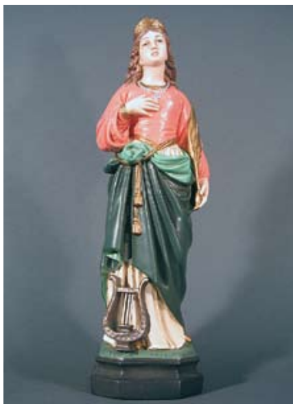
Hl. Cecilia Du standhafte Christin, lass uns mit Dir, Gott ehren und lobpreisen!