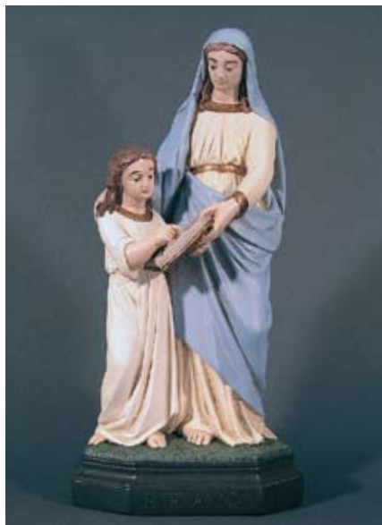
Hl. Anna Segne unsere Familien, Eltern und Kinder!