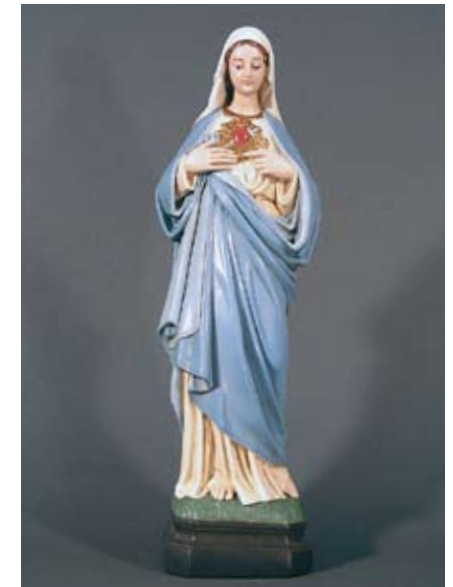
Herz Maria Liebe Mutter, Dir schenke ich mein ganzes Herz & weihe mich Deinem reinen Herzen.