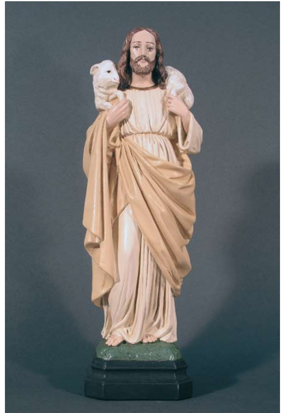
Jesus Guter Hirte Ich bin der gute Hirte (Joh. 10, 11.14)