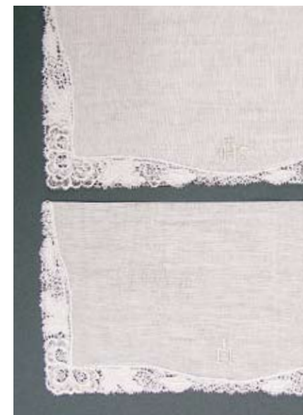
Gestickte Altartüchli Appenzeller-Handstickerei 25 × 25 cm, Baumwolle, JHS oder M, 58.– SFr. pro Stk.