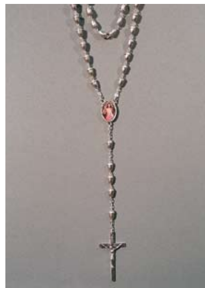
Rosenkranz Herz Jesu Metall versilbert, 25.- SFr.