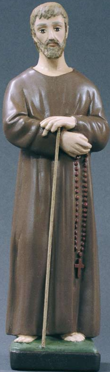
Heiliger Bruder Klaus Unser Landesheiliger aus der Innerschweiz. Erhöre unsere Bitten und führe uns zum Frieden in der Kirche und der Welt!