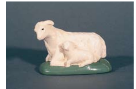
Mutterschaf mit Lamm 65.- SFr.