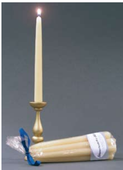
Schweizer Bienenwaxkerzen handgezogen, 12 cm, 10 Stk, 8.50 SFr.