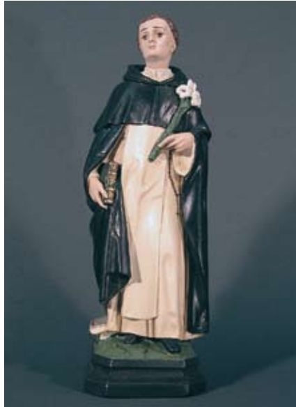
Hl. Dominik (25 cm) Wir wollen vollkommen dem Gebet und dem Dienst am Wort Gottes gewidmet sein.