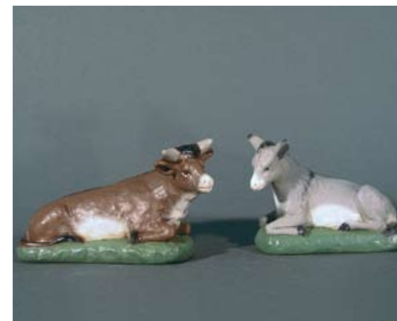
Esel & Ochse 95.– SFr.