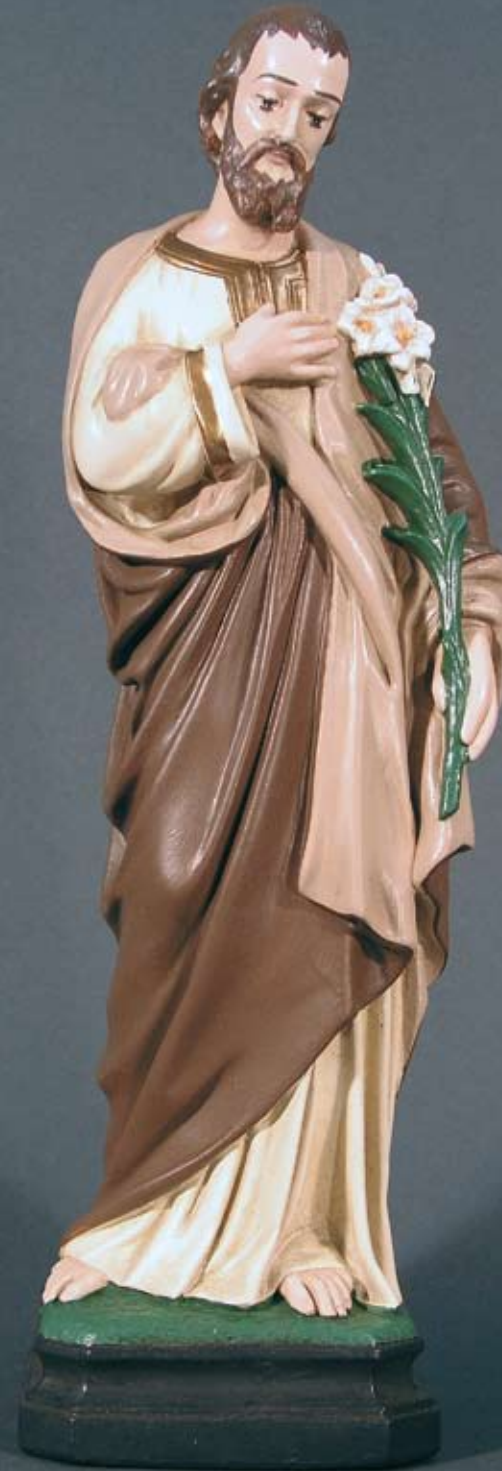
Hl. Josef Bräutigam der Mutter Gottes, Vorbild der Liebe und Treue! Bitte für uns!