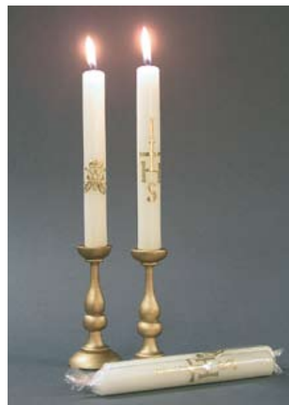
Sakrale Kerzen Mit Jesus und Maria Monogramm 4 Stk. mit 55% Bienenwachs, 25.– SFr.

Nelle queste pagine trova anche una selezione di prodotti naturali d'alta qualità per decorare l'altare in casa, come per esempio incenso puro (Boswelia) senza profumi artificiali, candele in cera d'api o fazzoletti con pizzi macramè ricamo a mano nel Appenzell.