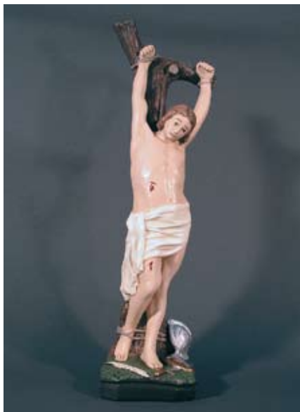
Hl. Sebastian Treu dem Glauben, treu der Pflicht, treu bis in den Tod.