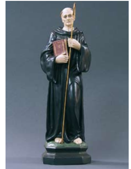
Hl. Benedikt Du Bote des Friedens Christi! Patron Europas, bleibe uns immer nahe!