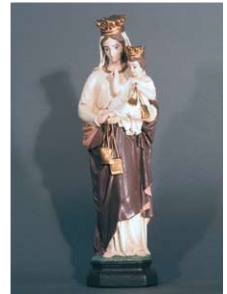
Maria vom Berg Karmel Trage dieses Skapulier als Zeichen Deiner Liebe und Verbundenheit zu Maria.