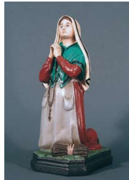
Hl. Bernadette Passend zur Lourdes-Muttergottes. Statuenhöhe 20 cm