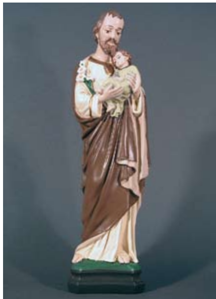
Hl. Josef mit Jesuskind Du gütiger Vater, Patron der Familien und Arbeiter, segne uns!