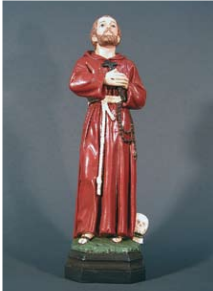
Hl. Franziskus v. Assisi Gepriesen seist Du mein Herr durch Bruder Mond, die Sterne und Schwester Sonne.