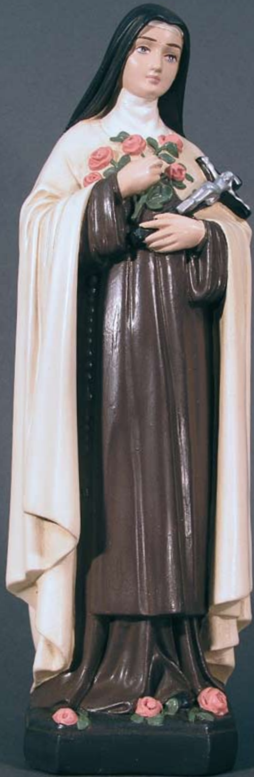
Hl. Therese «Mögest Du in Zufriedenheit wissen, dass Du ein Kind Gottes bist!»