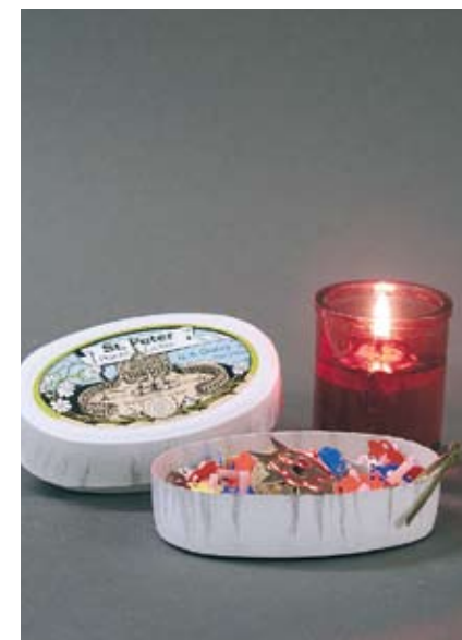
Öllichter St. Peter 1 Dose, 5.- SFr.