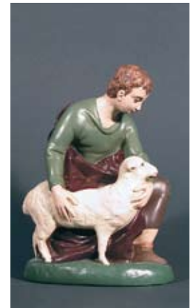
Hirte mit Schaf 105.- SFr.