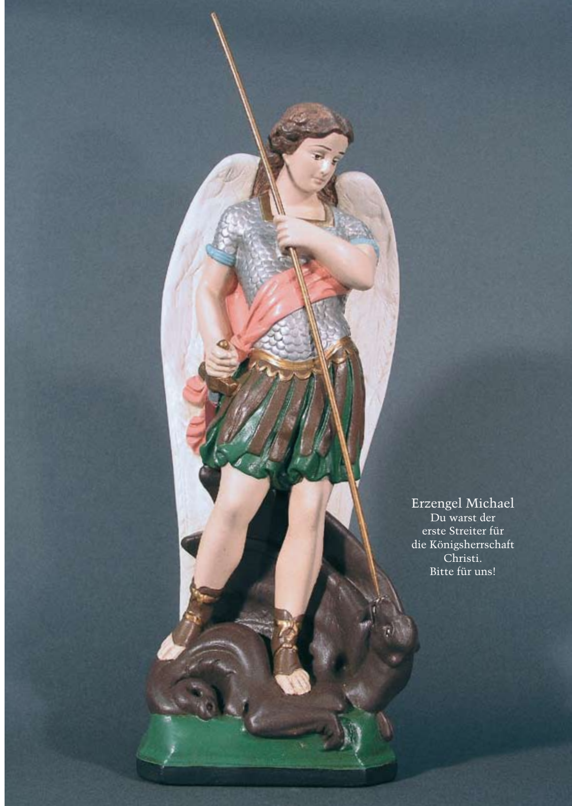
Erzengel Michael Du warst der erste Streiter für die Königsherrschaft Christi. Bitte für uns!