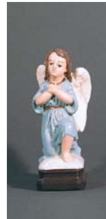
Engel für Krippe oder Hausaltar 14cm, 95.- SFr.