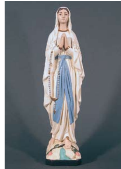
Notre Dame de Lourdes Ave Maria, Jungfrau voller Güte!