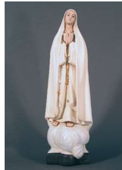
Fatima Muttergottes Fürchtet Euch nicht! Betet den Rosenkranz!