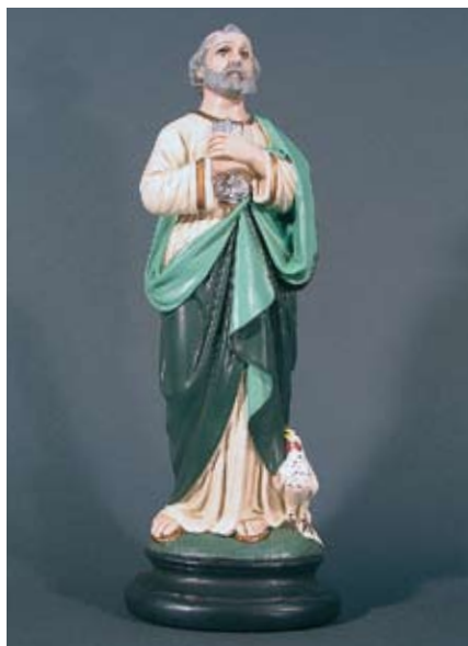
Hl. Petrus Nachfolgen heisst, die Stimme Jesus ken- nen und sich dem Wort Gottes anvertrauen.