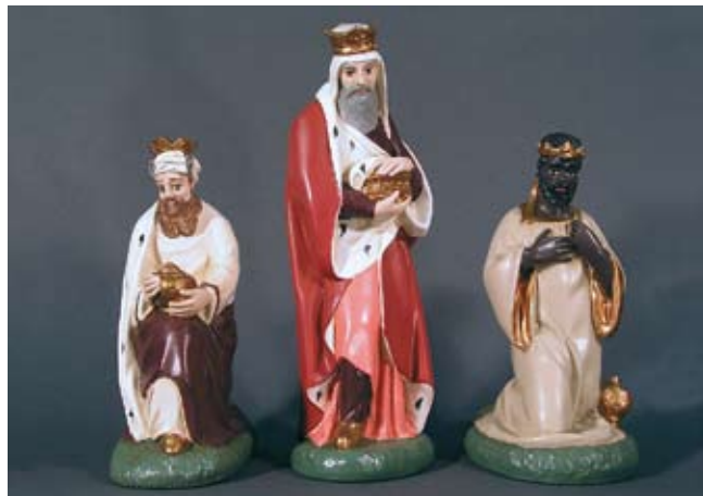
Hl. Drei Könige 315.- SFr. Caspar, Melchior, Balthasar