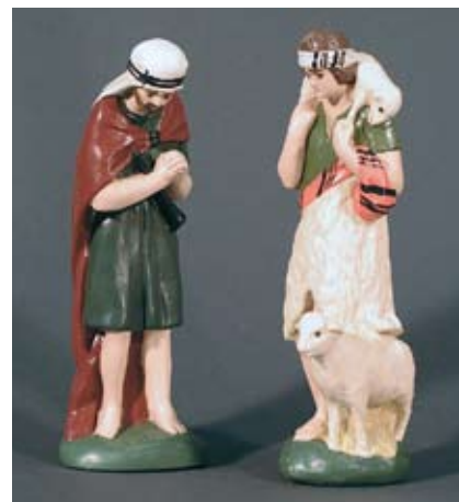
2 Hirten 110.– SFr.