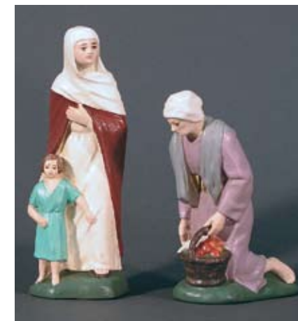
2 Landfrauen 110.– SFr.