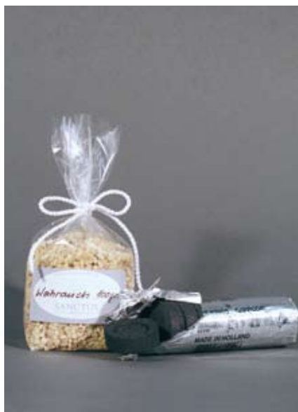
Reiner Boswalia Weihrauch 100g mit Brennkohle, 10 Stk, 15.50 SFr.